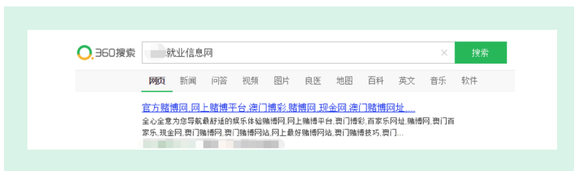
图1 网站被黑导致标题摘要被篡改